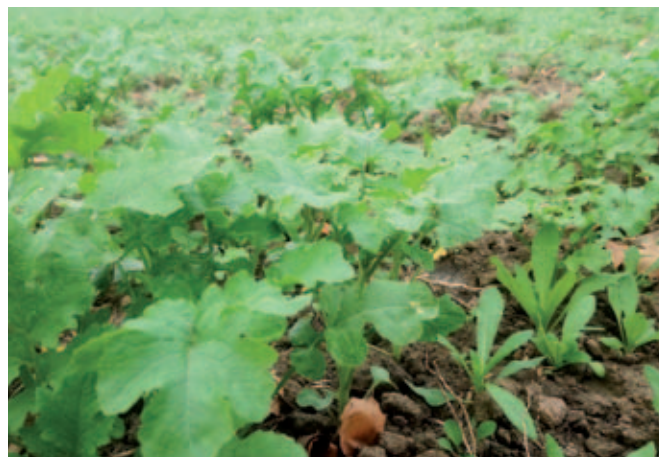
Detail rostliny lničky a hořčice 30 dní po zasetí.